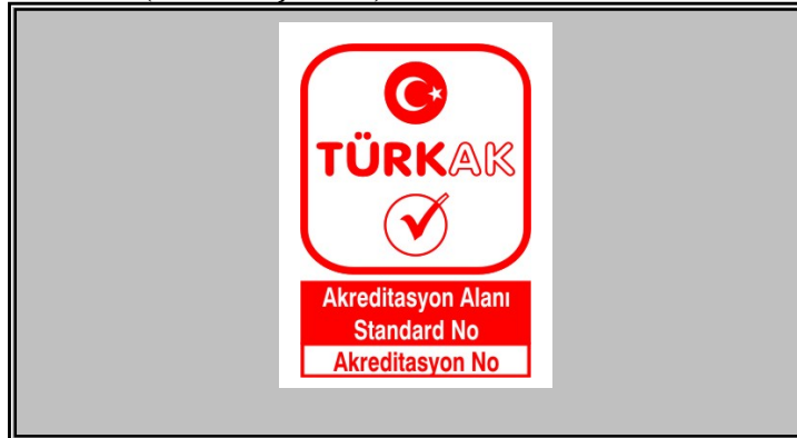
Şekil 3: TÜRKAK Akreditasyon Markasının beyaz zeminli dokümanlar haricindeki dokümanlarda kullanım şekli