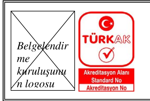
Şekil 6: Belgelendirme kuruluşunun logosu ve TÜRKAK Akreditasyon Markasının ilgili sertifikada kullanım şekli