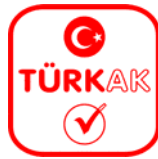
Şekil 1: TÜRKAK Logosu

TÜRKAK Logosu: TÜRKAK'ın kendi ismini veya akreditasyon programlarını tanıtmak için kullandığı sembol