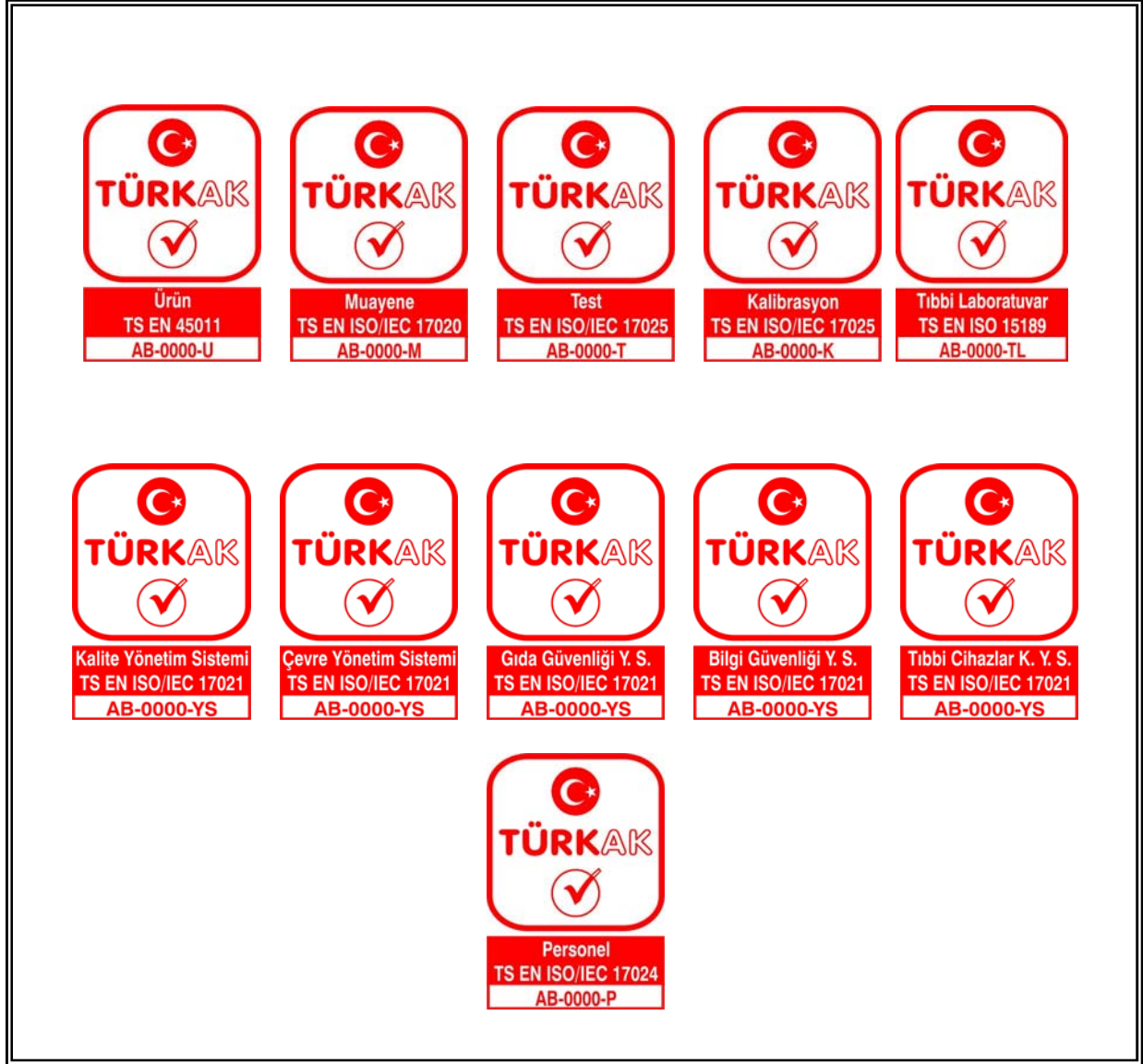
Şekil 4: TÜRKAK Akreditasyon Markası Örnekleri